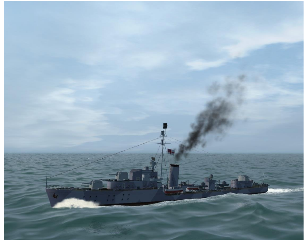
Rauchsäule ( NEU )