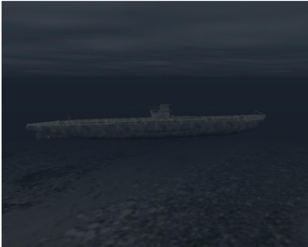
unter Wasser ( ALT )