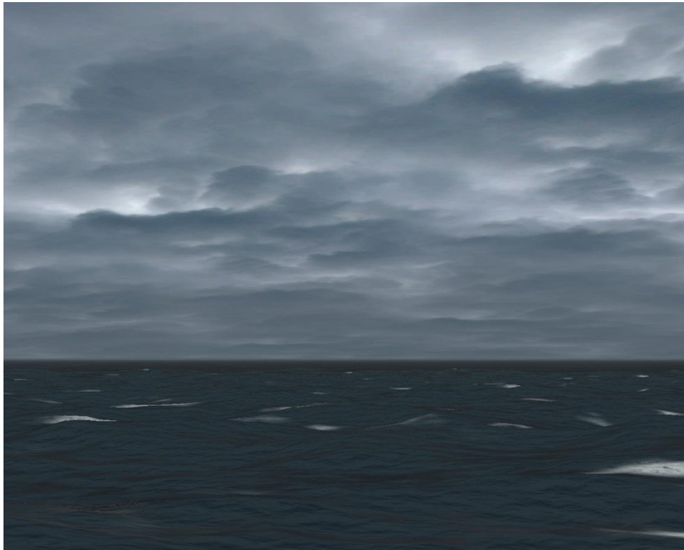
Schlechtwetter ( ALT )