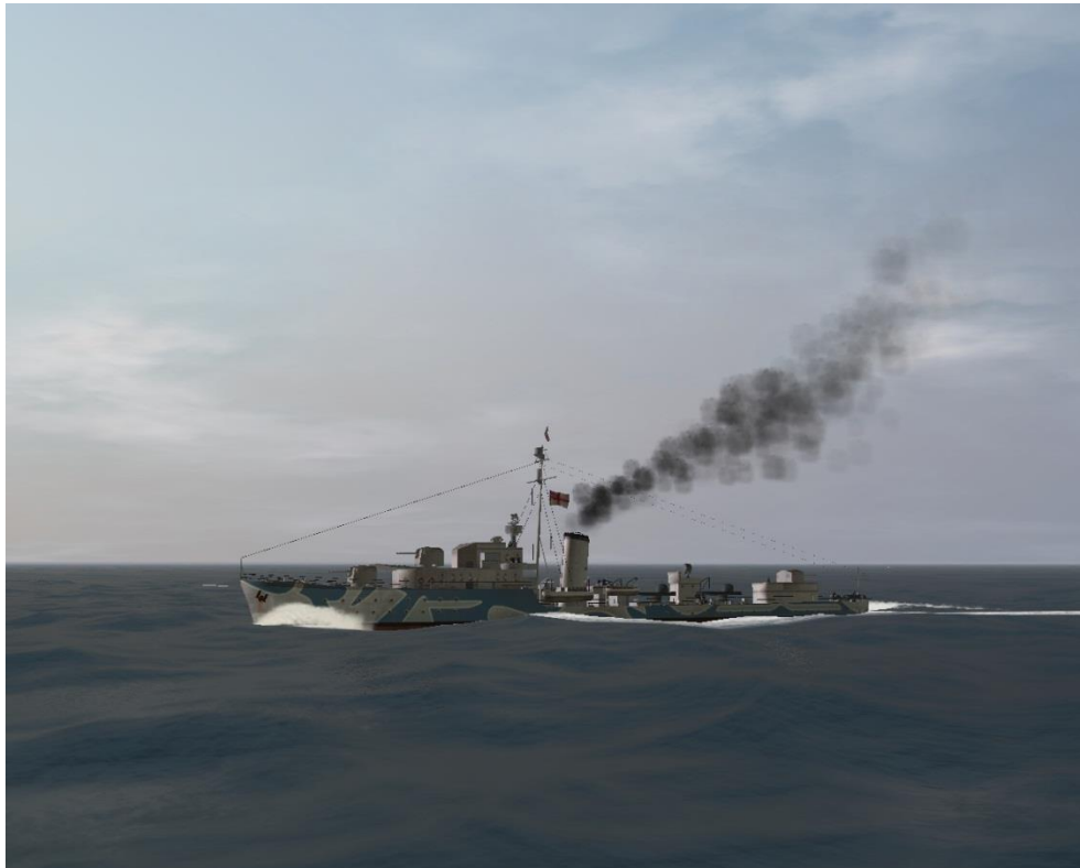
Rauchsäule ( ALT )