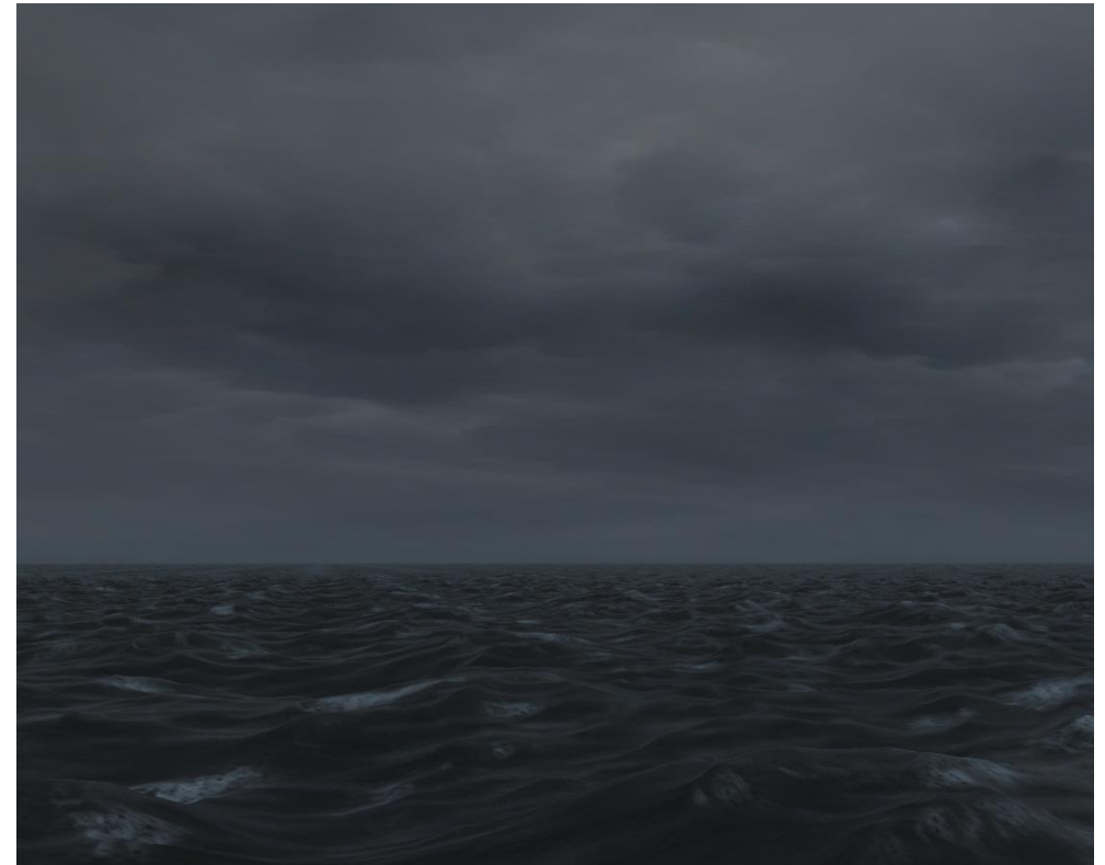
Schlechtwetter ( NEU )