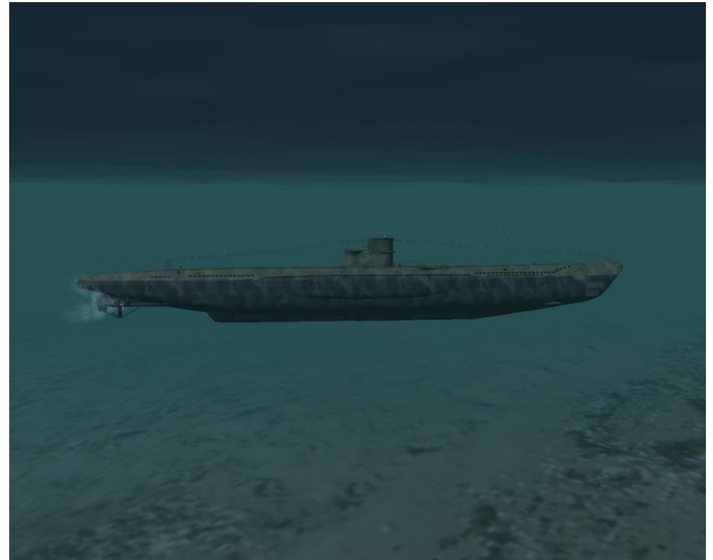
unter Wasser ( NEU )