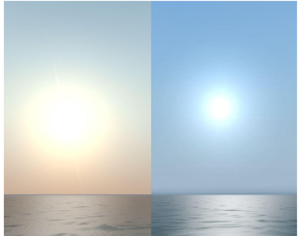
Sonne Alt und Neu